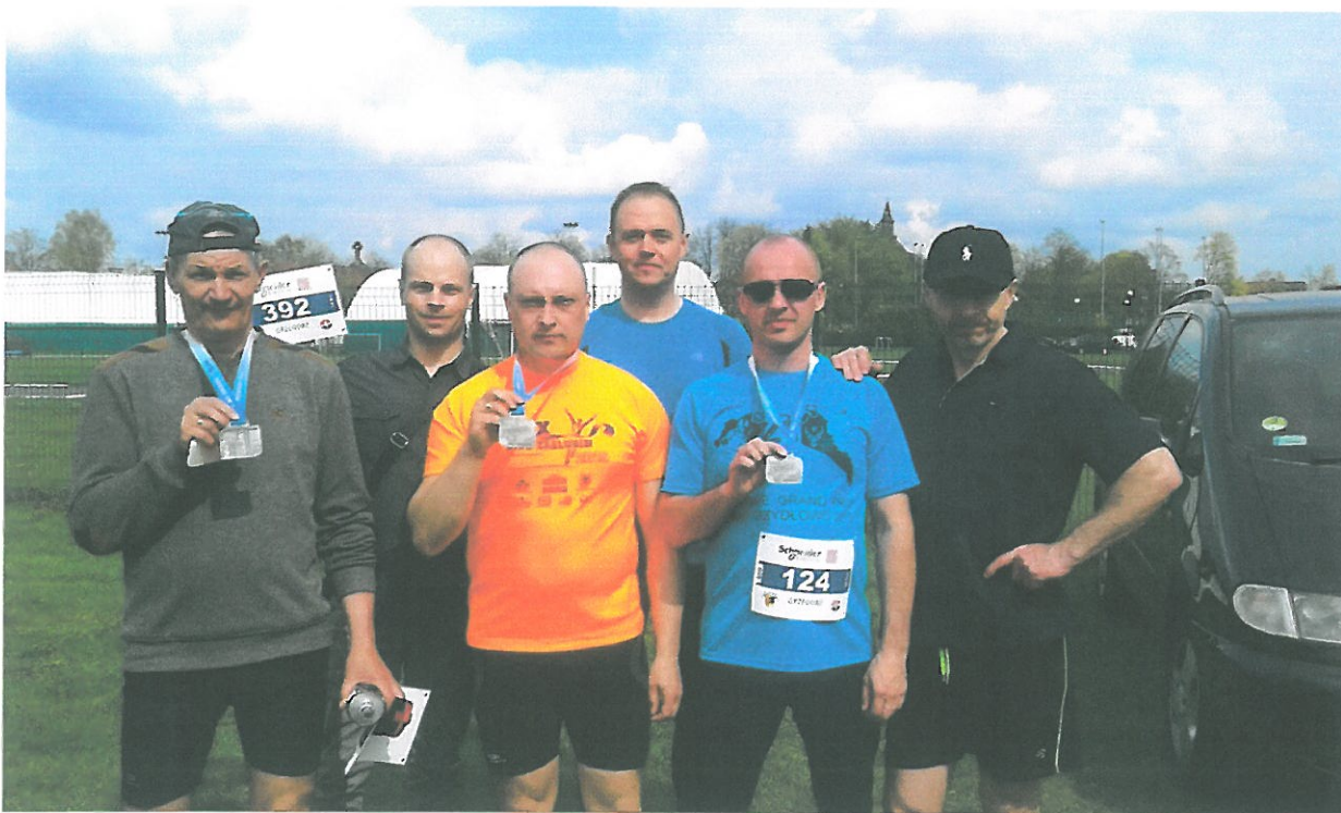
SZCZECINEK- BIEG NA 10 km – 24 KWIECIEŃ 2016r.

- RESKO „BIEG O STRZAŁĘ WIDANTA” 01.05.2016r.- 10 km.