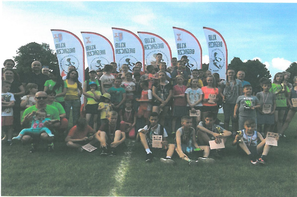
ŚWIDWIN, BIEGI DLA DZIECI „ OD PRZEDSZKOLAKA DO MARATOŃCZYKA”- 30 MAJ 2016 r.

- III EDYCJA BIEGÓW DLA DZIECI „ OD PRZEDSZKOLAKA DO MARATOŃCZYKA” 30 MAJ 2016r., liczba uczestników prawie 200 osób.