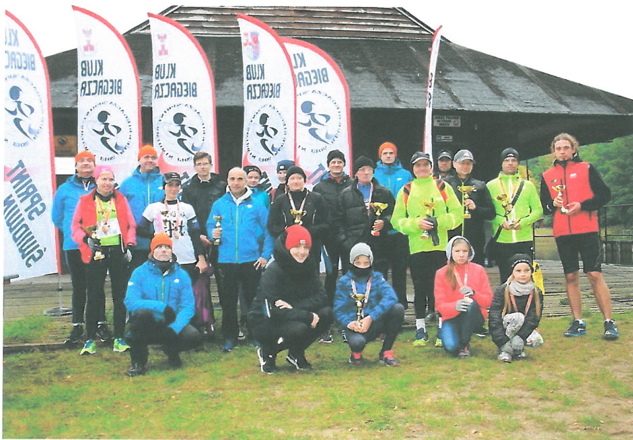
J. BUKOWIEC 2 BIEG PRZEŁAJOWY – 16 PAŹDZIERNIK 2016r.

(rekord frekwencji, wystartowało prawie 80 osób)