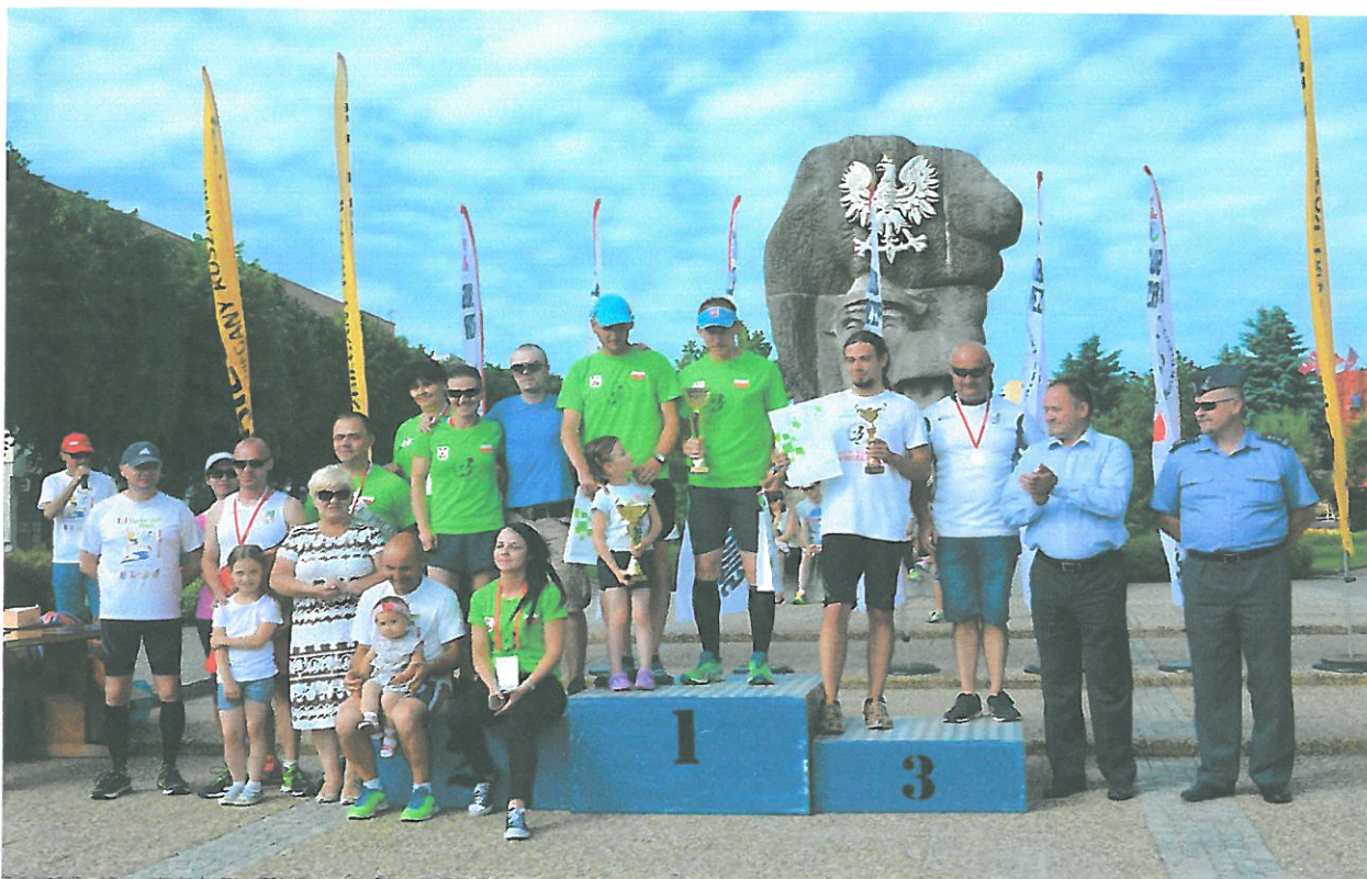
ŚWIDWIN, III DYCHA NAD REGĄ – 05 CZERWIEC 2016r.

(rekord frekwencji, wystartowało blisko 250 zawodników z całej Polski)