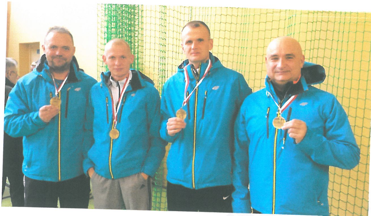
OKONEK- 6 LISTOPAD 2016 r.- 10 km.