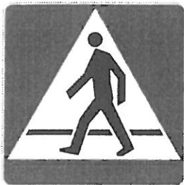
D-6 Przejście dla pieszych (znak informacyjny)