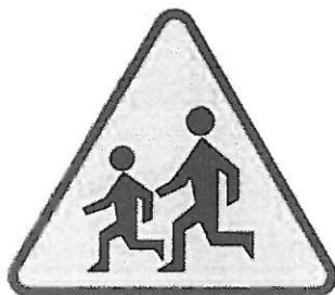
A-17 Uwaga dzieci