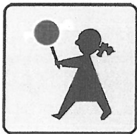
T-27 Przejście dla pieszych szczególnie uczęszczane przez dzieci