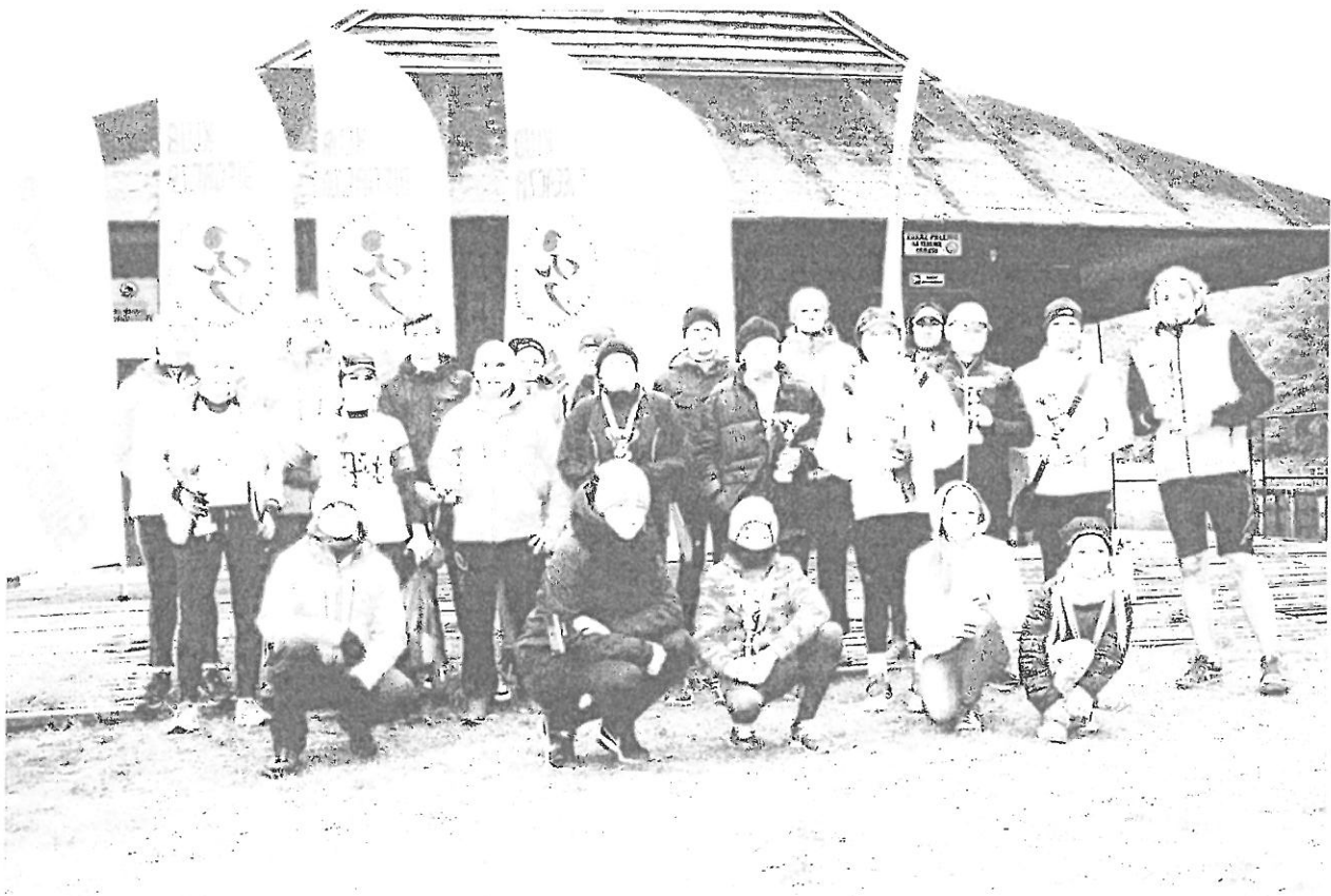
J. BUKOWIEC 2 BIEG PRZEŁAJOWY – 01 PAŹDZIERNIK 2017r.