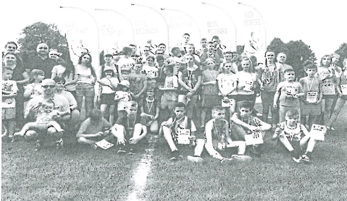
ŚWIDWIN, BIEGI DLA DZIECI „OD PRZEDSZKOLA DO MARATOŃCZYKA”- 01 CZERWIEC 2017 r.

- IV EDYCJA BIEGÓW DLA DZIECI „OD PRZEDSZKOLA DO MARATOŃCZYKA” 01 CZERWIEC 2017r., liczba uczestników prawie 150 osób.