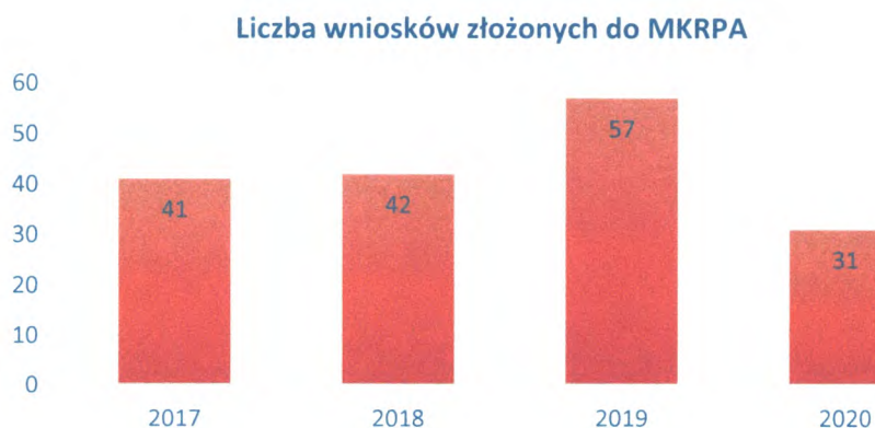
Wykres 2. Liczba wniosków złożonych do Miejskiej Komisji Rozwiązywania Problemów Alkoholowych w kolejnych latach.

Do Miejskiej Komisji Rozwiązywania Problemów Alkoholowych wpłynęło 31 wniosków o zobowiązanie do podjęcia leczenia odwykowego.