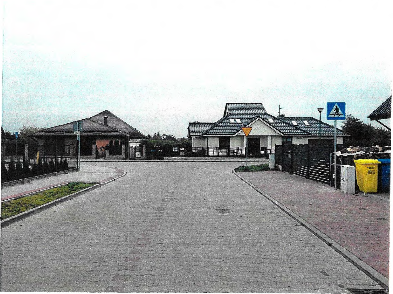
— 20221012_123846.jpg —